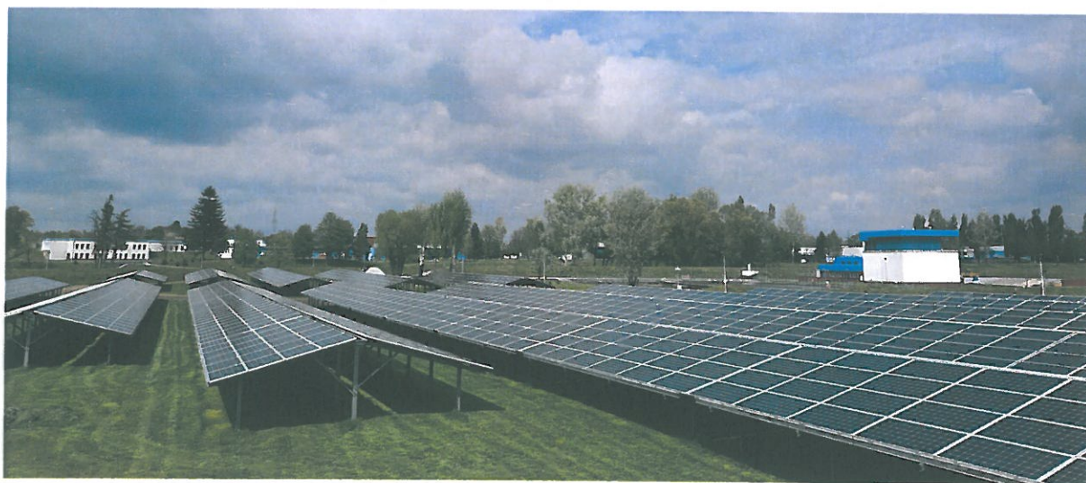
Instalacja fotowoltaiczna zlokalizowana na terenie Zakładu Uzdatniania Wody przy ul. Zwiężczyckiej w Rzeszowie